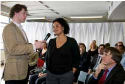
Mevrouw Joyce benadrukt het belang van leerlinggericht onderwijs