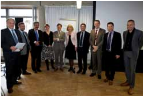
Het trotse bestuur aan het begin van een belangrijke missie