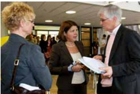
Staatssecretaris Van Bijsterveldt na afloop in gesprek met de mensen uit het veld