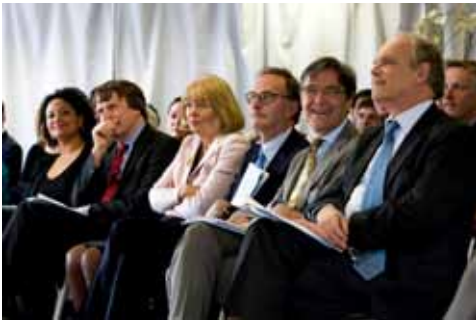
De zaal reageert enthousiast op de introductiefilm over de onderwijspraktijk